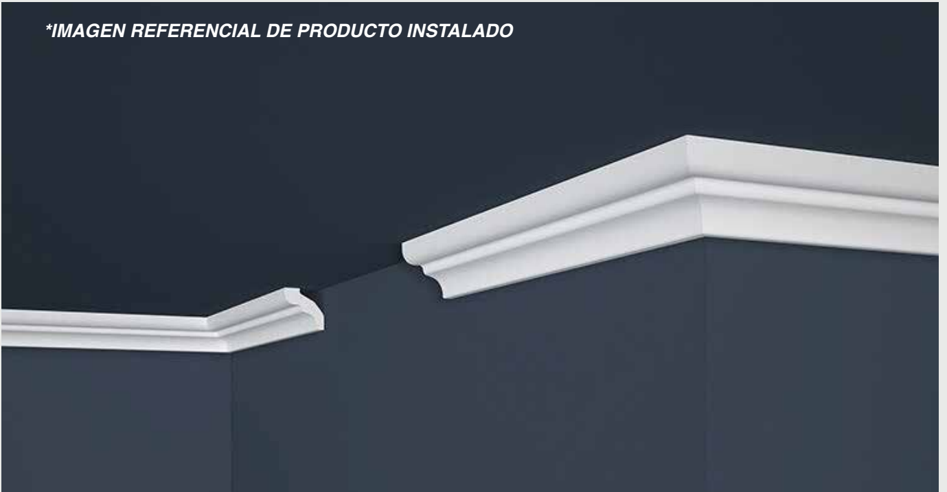
*IMAGEN REFERENCIAL DE PRODUCTO INSTALADO

Condiciones Técnicas de WT-XPS-01 Certificado Técnico CT 8/WT/2013 Certificado Técnico CT 9/WT/2013. Certificado de Higiene NIZP-PZH HK/B/0980/01/2016