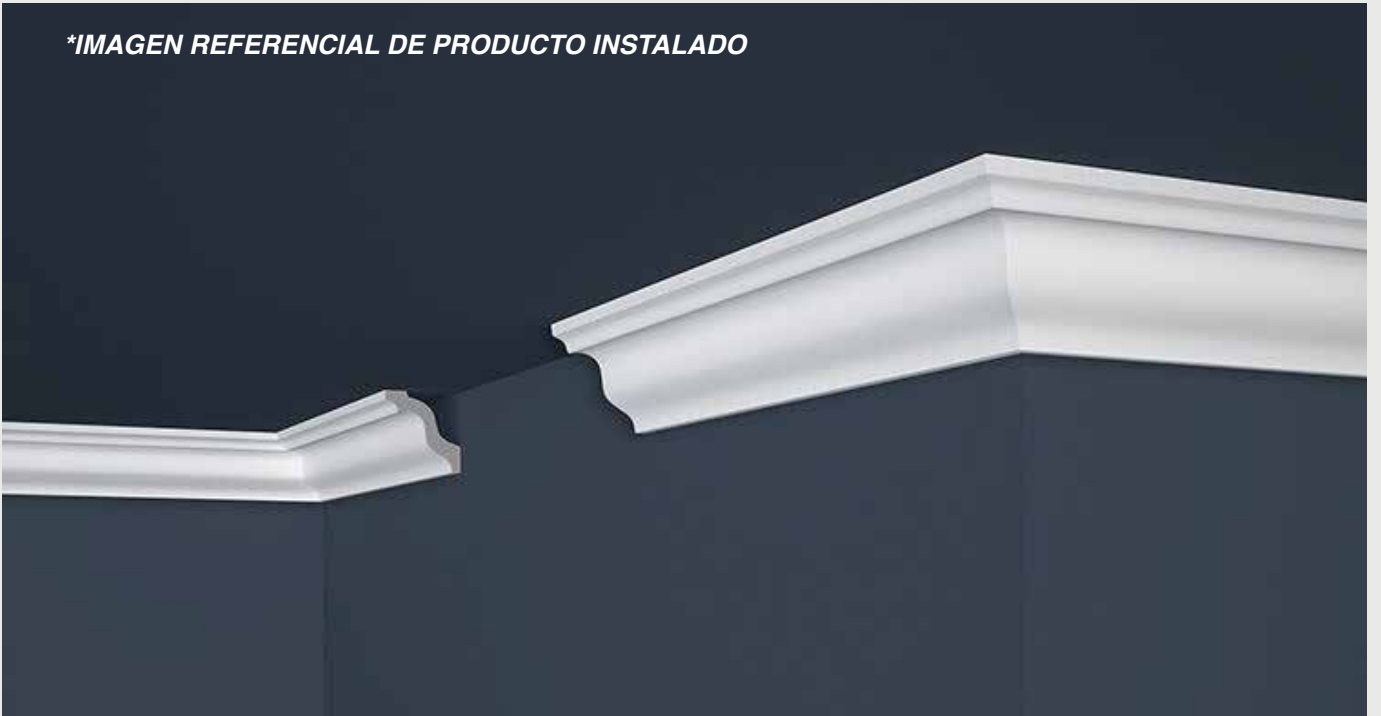
*IMAGEN REFERENCIAL DE PRODUCTO INSTALADO

Condiciones Técnicas de WT-XPS-01 Certificado Técnico CT 8/WT/2013 Certificado Técnico CT 9/WT/2013. Certificado de Higiene NIZP-PZH HK/B/0980/01/2016