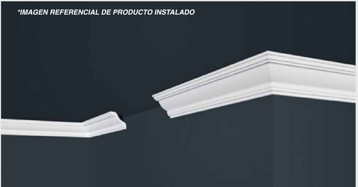
*IMAGEN REFERENCIAL DE PRODUCTO INSTALADO

Condiciones Técnicas de WT-XPS-01 Certificado Técnico CT 8/WT/2013 Certificado Técnico CT 9/WT/2013. Certificado de Higiene NIZP-PZH HK/B/0980/01/2016