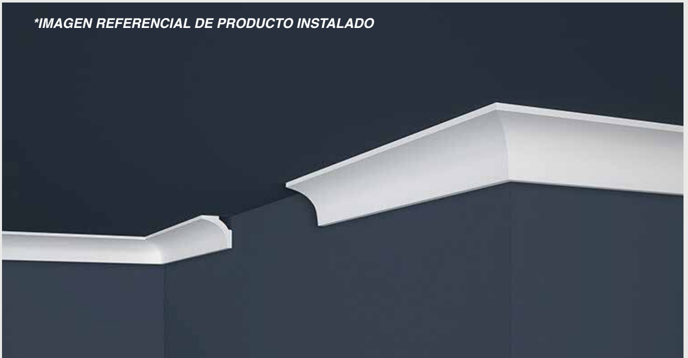
*IMAGEN REFERENCIAL DE PRODUCTO INSTALADO

Condiciones Técnicas de WT-XPS-01 Certificado Técnico CT 8/WT/2013 Certificado Técnico CT 9/WT/2013. Certificado de Higiene NIZP-PZH HK/B/0980/01/2016